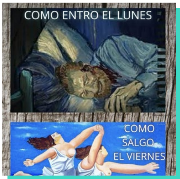
Diferentes trabajos realizados por alumnado en cursos anteriores