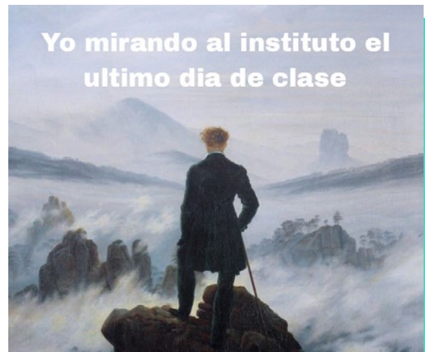
Diferentes trabajos realizados por alumnado en cursos anteriores