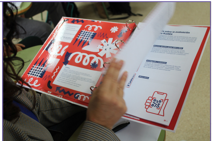
Entrega de Cuaderno de Gestión - IES Guillem D'Alcalà.

Los centros finalmente elegidos se comprometen a: