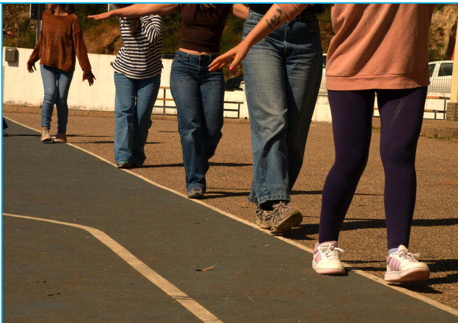
CEIP As Covas - Meaño.

La intención de esta nueva fase de PLANEA es consolidar aprendizajes y ofrecer un modelo concreto desde el que pensar las relaciones entre arte y escuela de forma experimental y situada. Lo que hemos llamado “hoja de ruta PLANEA” integra un itinerario coordinado para los centros de nueva incorporación a la red.