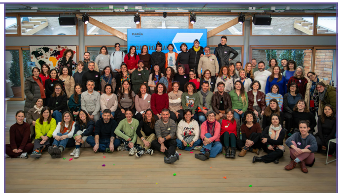
Encuentro Estatal PLANEA 2026.

PLANEA es una red de centros educativos, agentes e instituciones culturales que utilizan las prácticas artísticas de manera transversal, situada en el territorio y con vocación de generalización y permanencia en la escuela pública.