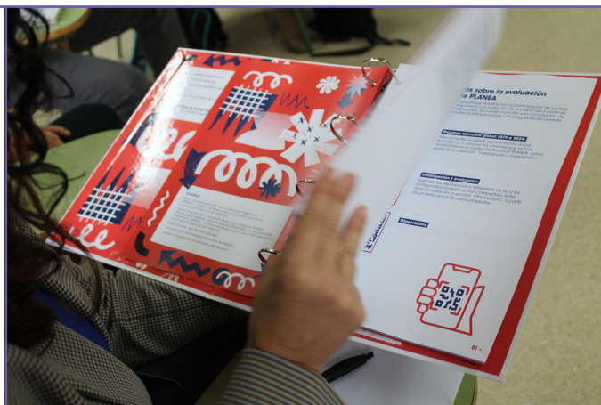
Kudeaketa Koadernoaren Lagapena - IES Guillem D'Alcalà.

Azkenean aukeratutako ikastetxeek konpromiso hauek hartzen dituzte: