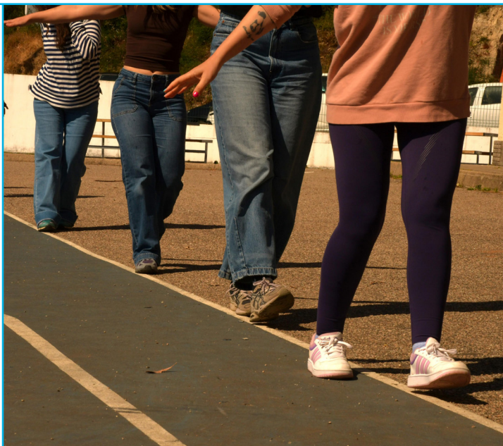
CEIP As Covas - Meaño.

PLANAREN fase berri honen asmoa da ikaskuntzak sendotzea eta eredu zehatz bat eskaintzea artearen eta eskolaren arteko harremanak modu esperimental eta kokatuan pentsatzeko. «PLANEA ibilbide-orria» deitu dugun horrek ibilbide koordinatu bat barne hartzen du sarean sartu berri diren ikastetxeentzat.