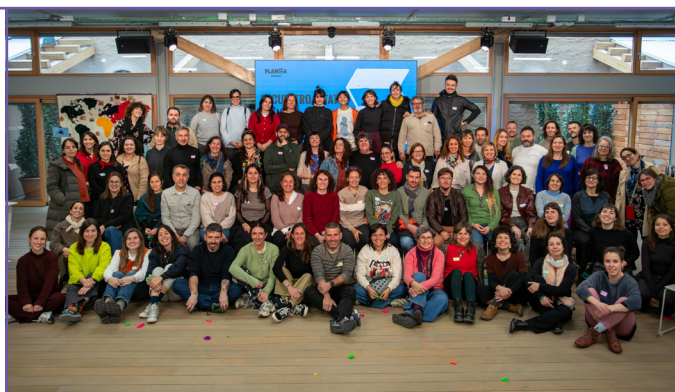
Trobada Estatal PLANEA 2026.

PLANEA és una xarxa de centres educatius, agents i institucions culturals que utilitzen les pràctiques artístiques de manera transversal, situada en el territori i amb vocació de generalització i permanència en l'escola pública.