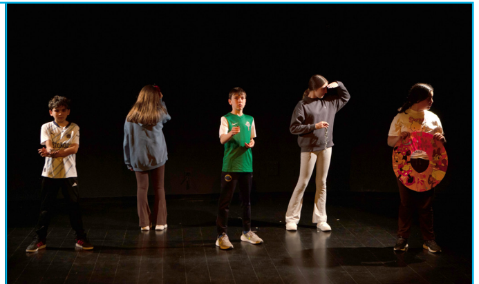
La Morsa, Centre del Titella d'Alcorcón.

La participació en PLANEA és totalment voluntària, gratuïta i conscient de les dificultats organitzatives i pedagògiques dels centres educatius públics.